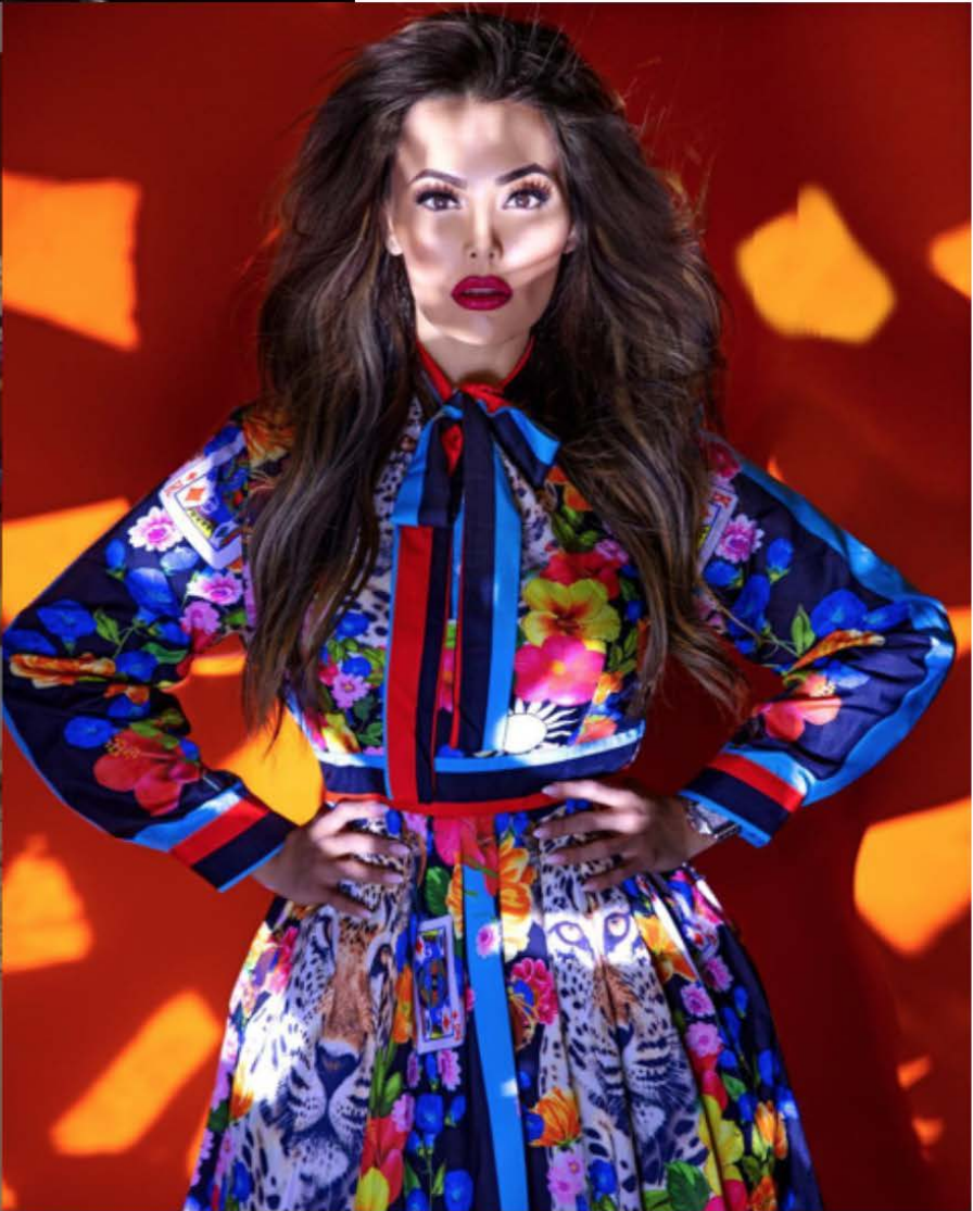
“Top 6 Latinas You Should Know” by Univision and Latina Magazine